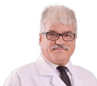
Durvalino de Oliveira Presidente da Comissão de Tomada de Contas